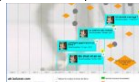
Fig.4 - Le site http://air.laclassse.com , au mois de juin

<a href='http://lettres-lca.enseigne.ac-lyon.fr/spip/IMG/jpg/air.laclassse.jpg' title='Fig.4 - Le site http://air.laclassse.com, au mois de juin' type='image/jpeg'>